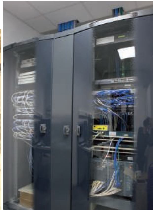
◀ Pour assurer le bon fonctionnement du magasin, tant au niveau du réseau informatique que téléphonie, 240 prises RJ 45 cat 6 FTP sont nécessaires.