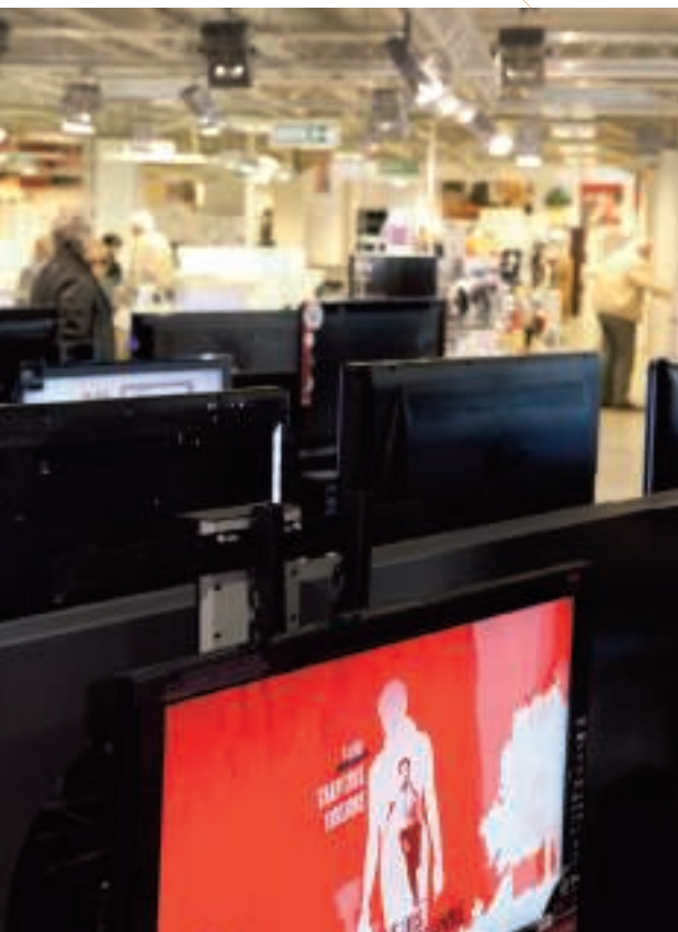
▲ Présents uniquement en région PACA, les magasins Privilège proposent des écrans plats exclusifs à prix discount.

▼ Grâce au repérage clair sur les montants latéraux, fini les opérations d'alignements longues et fastidieuses des panneaux de brassage et tablettes.