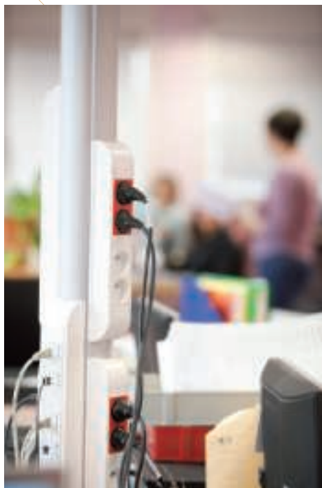
▲ Plus de flexibilité avec les colonnes du Programme Mosaic.