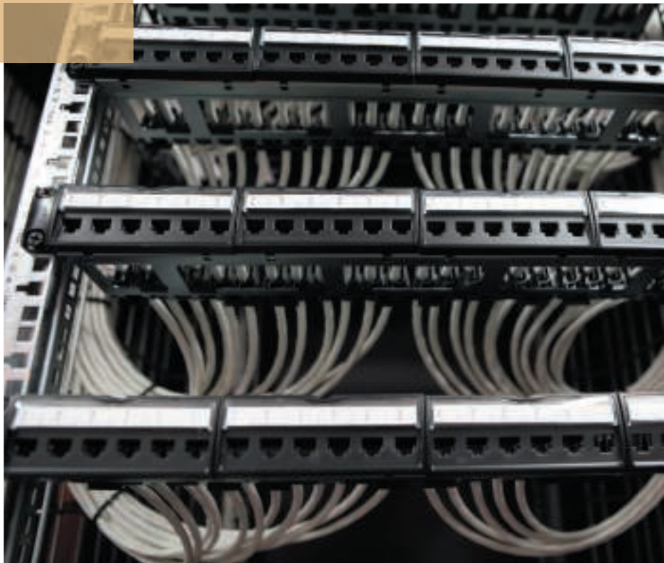
▲ Grâce aux blocs 6 connecteurs RJ 45 qui s'ouvrent par l'avant, les interventions sont facilitées.