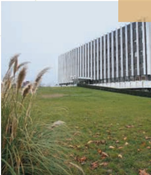
▲ L'hôtel des Finances de Grenoble renferme des données confidentielles qu'il convenait de protéger par une nouvelle installation.