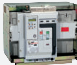
DMX fixe transformé en débrochable équipé de l'unité de protection (MP 18)