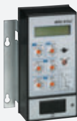
Unité MP 18

Sur demande les DMX peuvent être équipés d'une unité de protection électronique (MP 18 ou MP 20) dotée d'un afficheur à cristaux liquides réglable par clavier et d'une unité de mémoire externe sur les versions débrochantes