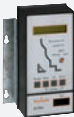
Unité MP 20