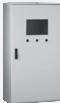
Armoire Marina percée et équipée en usine

Réalisation de perçages sur toutes les parties de l'armoire, porte interne, plaque pleine ... Plans de perçage à fournir