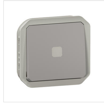
Interrupteur temporisé lumineux sans Neutre étanche Plexo 230V 50Hz à 60Hz IP55 IK05 avec enjoliveur finition gris