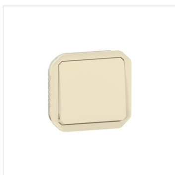
Interrupteur ou va-et-vient étanche Plexo 10AX 250V~ IP55 IK08 avec enjoliveur finition sable