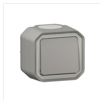
Interrupteur ou va-et-vient étanche Plexo 10AX 250V~ IP55 IK08 livré complet pour fixation saillie - gris