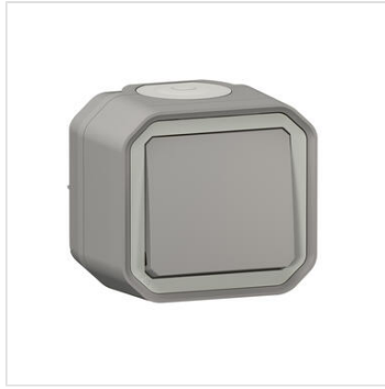
Poussoir NO étanche Plexo 10A IP55 IK08 livré complet pour fixation saillie - gris