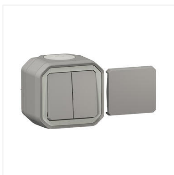
Transformateur étanche réversible pour réaliser 5 fonctions Plexo IP55 IK08 livré complet pour fixation saillie - gris