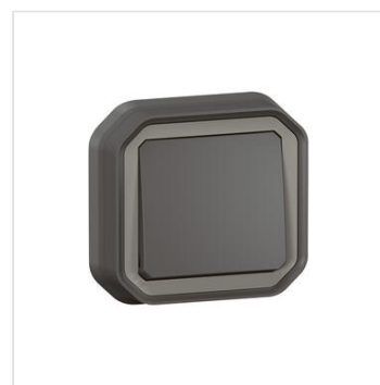
Interrupteur ou va-et-vient étanche Plexo 10AX 250V~ IP55 IK08 livré complet pour fixation en encastre - anthracite