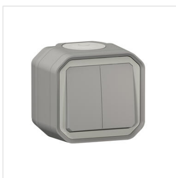
Commande double étanche pour réaliser 3 fonctions Plexo IP55 IK08 livrée complète pour fixation saillie - gris