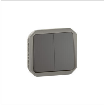
Commande double étanche pour réaliser 3 fonctions Plexo IP55 IK08 avec enjoliveur finition anthracite