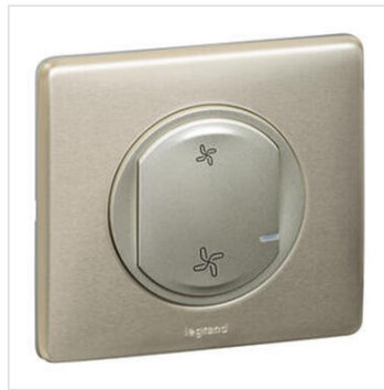
Commande sans fils pour VMC pour installation connectée Céliane with Netatmo - titane