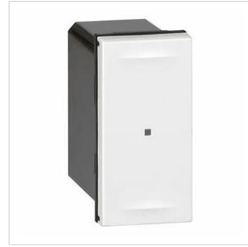
Micromodule pour rendre une VMC 2 vitesses connectée 250W max.