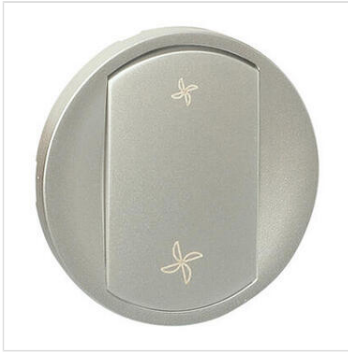
Enjoliveur Céliane pour commande VMC - finition titane