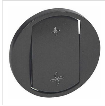
Enjoliveur Céliane pour commande VMC - finition graphite