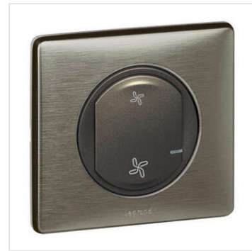
Commande sans fils pour VMC pour installation connectée Céliane with Netatmo - graphite