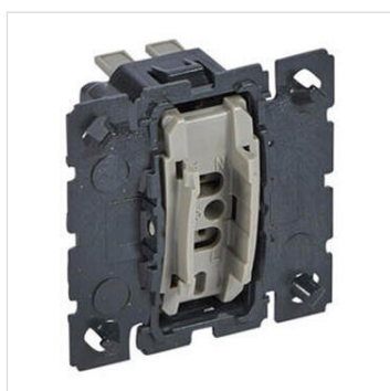
Interrupteur ou va-et-vient ou commande de VMC Céliane 10AX 230V~