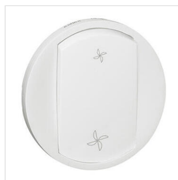
Enjoliveur Céliane pour commande VMC - Blanc