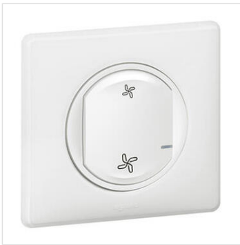
Commande sans fils pour VMC pour installation connectée Céliane with Netatmo - blanc