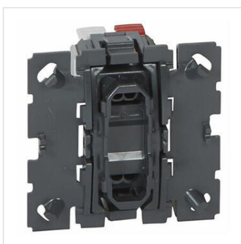
Poussoir inverseur Céliane 6A contact NO-NF ou poussoir VMC