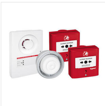
Prêt-à-poser tableau d'alarme incendie de type4 avec alimentation secteur