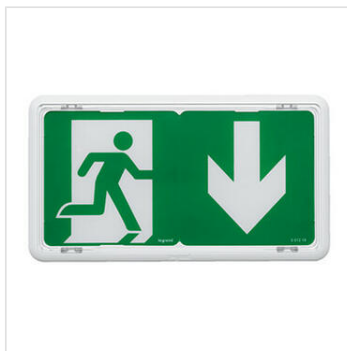
BAES d'évacuation saillie à LEDs 45lm 1h plastique IP43 IK07 SATI Connecté visibilité