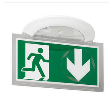
BAES d'évacuation encastré à LEDs 45lm 1h Kickspot IP40 IK04 plastique SATI Connecté