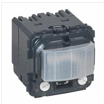
Détecteur de mouvements toutes lampes 2 fils Céliane sans neutre