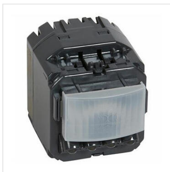
Interrupteur automatique de balisage Céliane 20lux