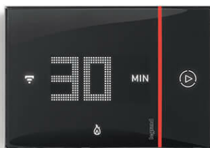
Activation de la fonction Boost