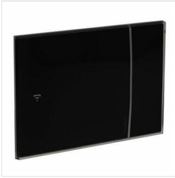
Thermostat connecté Smarter with Netatmo pour montage encastré 2 modules - noir