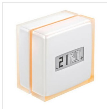
Thermostat Intelligent Netatmo pour rendre le chauffage connecté compatible chaudières et pompe à chaleur