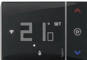
Température de consigne et réglage

Le thermostat connecté Smarter with Netatmo apportera à votre client confort et bien-être et lui permettra de réduire sa consommation électrique. Son interface tactile LED éclairée innovante et moderne permet d'accéder aux informations essentielles comme la température ambiante, la température de consigne, le taux d'humidité ou encore le mode actif de la fonction Boost.