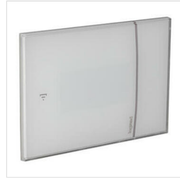
Thermostat connecté Smarter with Netatmo pour montage encastré 2 modules - blanc