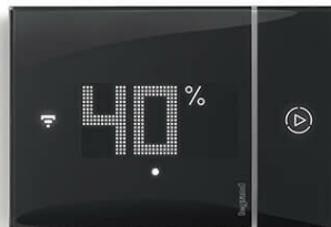
Taux d'humidité de la pièce