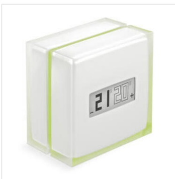
Thermostat Modulant Intelligent connecté Netatmo pour chaudière OpenTherm - saillie