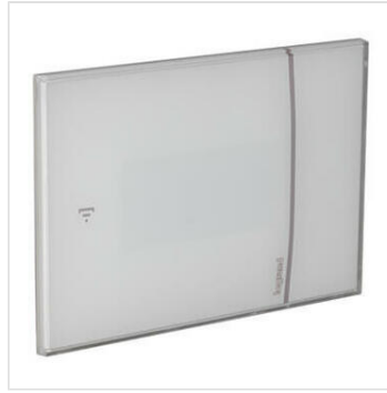
Thermostat connecté Smarter with Netatmo pour montage saillie - blanc